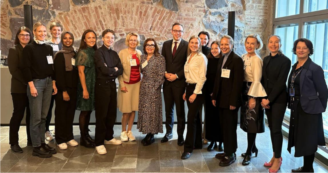
Työministeri Matias Marttisen koolle kutsuman naisyrittäjyyttä käsitelleen pyöreän pöydän keskustelun osallistujia.