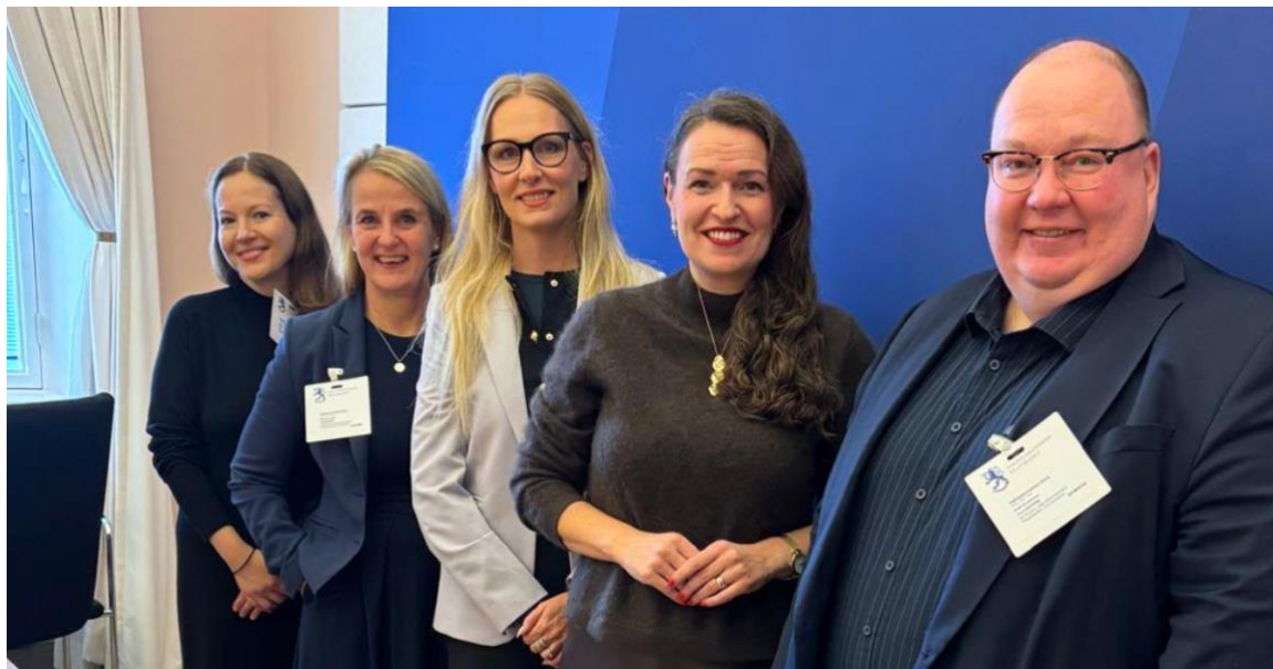
Kulttuurialan neuvottelukunnan (KALN) edustajat kunta- ja alueministeri Anna-Kaisa Ikkosta tapaamassa.

TAKU on erittäin aktiivinen useissa yhteistyö- ja sidosryhmäverkostoissa, kuten Kulttuurialan liittojen neuvottelukunnassa (KALN) sekä itsensätyöllistäjien työmarkkina- aseman parantamista ajavassa ITSET-ryhmässä.