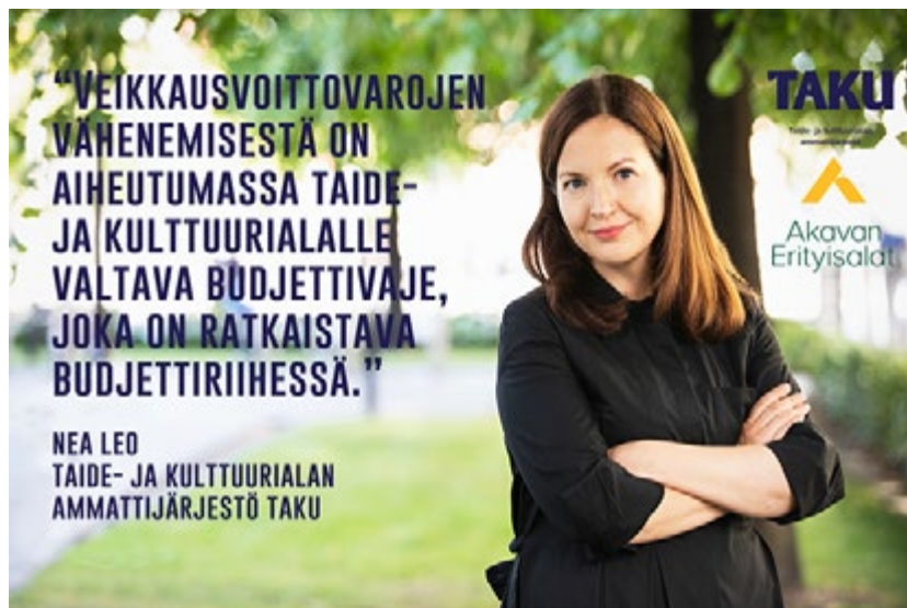
TAKU on ottanut voimakkaasti kantaa arpaajislain uudistusta koskevaan tilanteeseen myös yhdessä Akavan Erityisalojen ja sen muiden jäsenjärjestöjen kanssa.

TAKU teki linjauksia sponsorointikohteisiin ja summiin liittyen ja jakoi syksyllä päivitettyt ohjeet ja hakulomakkeen verkkosivuilleen.