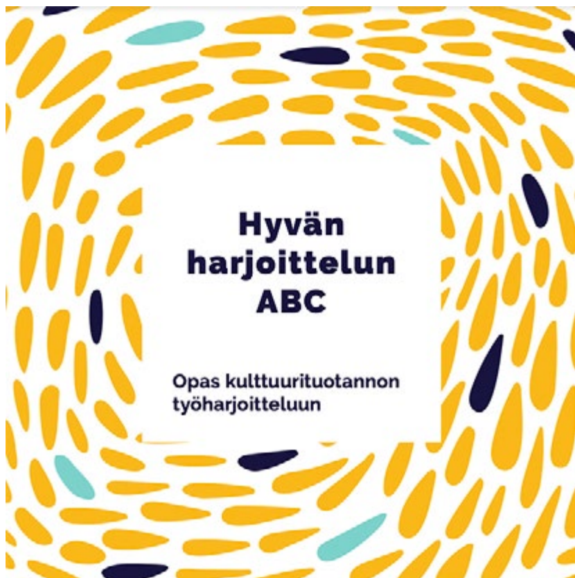
Kulttuurituotannon työharjoitteluun kehykset antava opas pyrkii vahvistamaan opiskelijoiden asemaa harjoittelijana.

sesta vastaavat jokaisen alueen yhteyshenkilöt TAKUn henkilökunnan avulla. Tapaamisten teemat ja ideat lähtevät kuitenkin aina kunkin alueen toimijoiden omista toiveista.