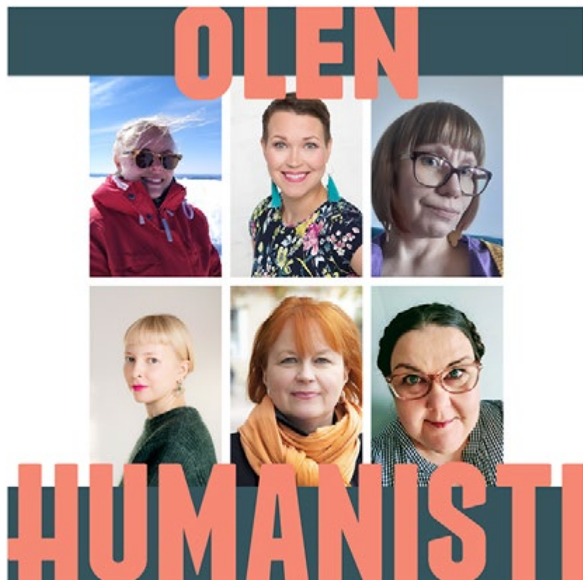
Olen humanisti -kampanja nosti esiin kuusi TAKUn jäsentä uratarinoineen.

infosta yksityiskohtaisempiin työharjoitteluun, työnhakuun tai ammatti-identiteetin löytämiseen liittyviin sisältöihin. Muuta perinteistä ja pitkäkestoista yhteistyötä oli osallistuminen valtakunnallisen Kulttuuritutkimuksen opiskelijat Kulo ry:n seminaariin